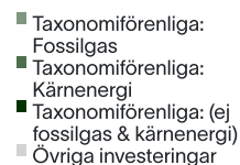
2. Taxonomiförenlighet hos investeringar, exklusive statliga obligationer*