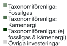
1. Taxonomiförenlighet hos investeringar, inklusive statliga obligationer*

De två diagrammen nedan visar i grönt minimiprocentandelen investeringar som är förenliga med EU-taxonomin. Eftersom det inte finns någon lämplig metodik för att avgöra hur taxonomiförenliga statsobligationer är*, visar det första diagrammet taxonomiförenligheten med avseende på den finansiella produktens alla investeringar, inklusive statsobligationer, medan det andra diagrammet visar taxonomiförenligheten endast med avseende på de investeringar för den finansiella produkten som inte är statsobligationer.