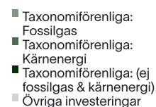
2. Taxonomiförenlighet hos investeringar, exklusive statliga obligationer*