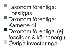
1. Taxonomiförenlighet hos investeringar, inklusive statliga obligationer*

De två diagrammen nedan visar i grönt minimiprocentandelen investeringar som är förenliga med EU-taxonomin. Eftersom det inte finns någon lämplig metodik för att avgöra hur taxonomiförenliga statsobligationer är*, visar det första diagrammet taxonomiförenligheten med avseende på den finansiella produktens alla investeringar, inklusive statsobligationer, medan det andra diagrammet visar taxonomiförenligheten endast med avseende på de investeringar för den finansiella produkten som inte är statsobligationer.